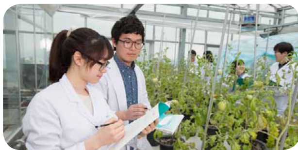
tại các hiện trường công nghiệp.

Khoa quản trị kinh doanh/Khoa du lịch quốc tế/Khoa thương mại quốc tế/Khoa thông tin kinh doanh